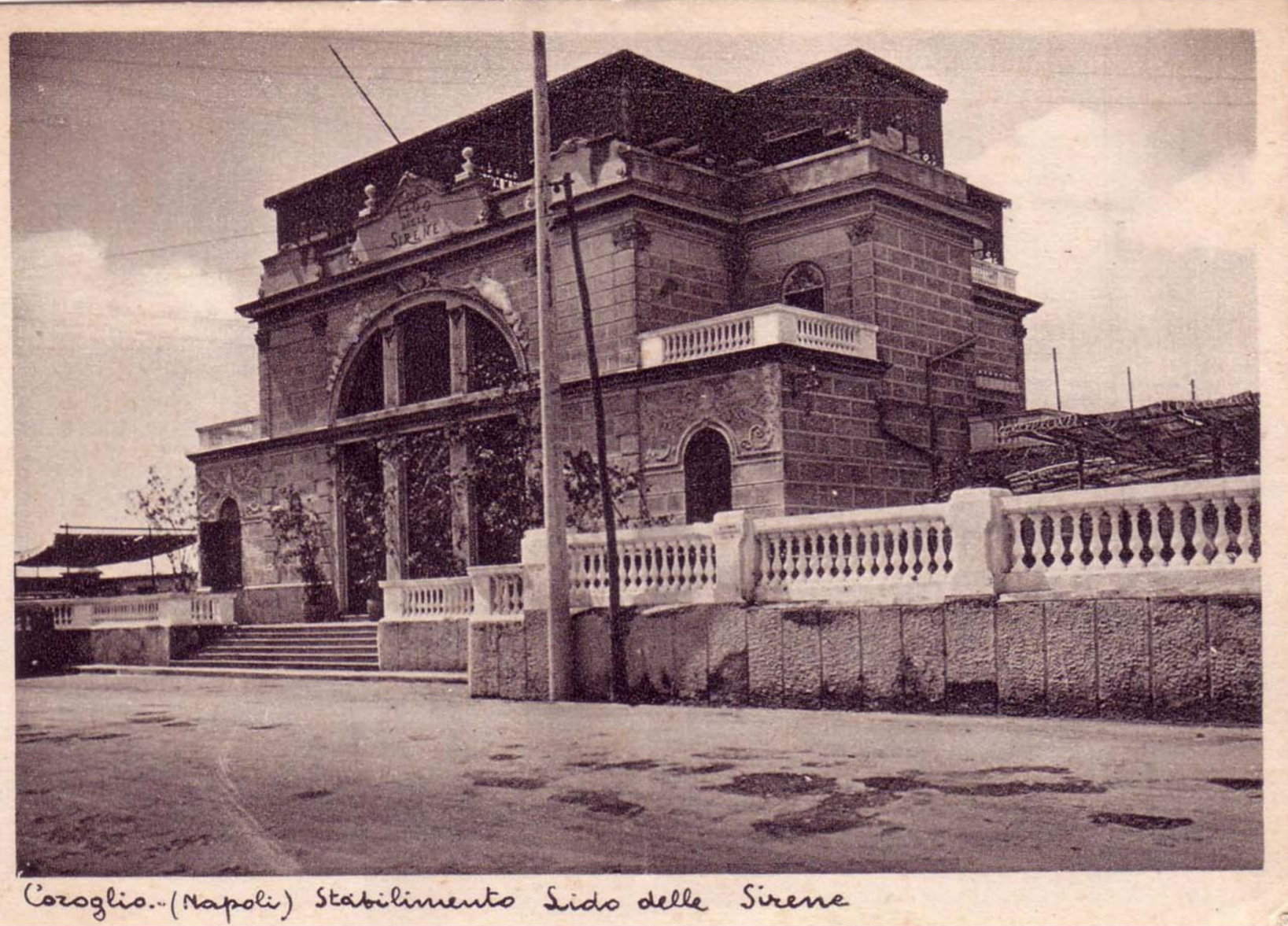
Coroglio..(Napoli) Stabilimento Lido delle Sirene